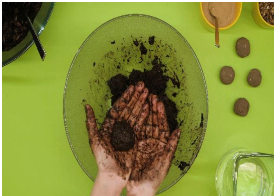
Video Samenkugeln https://youtu.be/aJ-y0fxYeKM